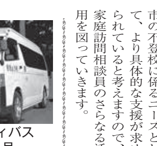
コミュニティバス ききょう号

今年度から開催する鎌ヶ谷市コミュニティバス運営検討委員会では現状の課題や改善方法を整理し、その必要性や有効性などを検討してまいります。