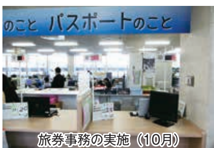
旅券事務の実施(10月)