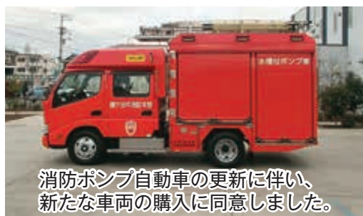
消防ポンプ自動車の更新に伴い、新たな車両の購入に同意しました。