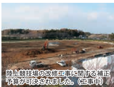
陸上競技場の改修工事に関する補正予算が可決されました。(工事中)