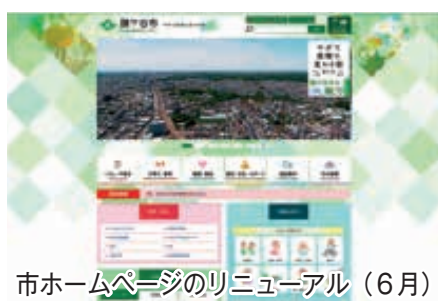
市ホームページのリニューアル(6月)