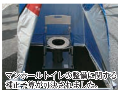
マンホールトイレの整備に関する補正予算が可決されました。

この議案は、現行の基本構想を含めた総合基本計画が、平成32年度に終了することから、本市の新たな総合基本計画の策定に必要な事項を定めるために制定されたものです。 また、18名の議員が市政に関する一般質問を行いました。