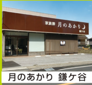
月のあかり 鎌ヶ谷