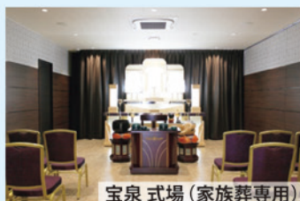
宝泉 式場 (家族葬専用)