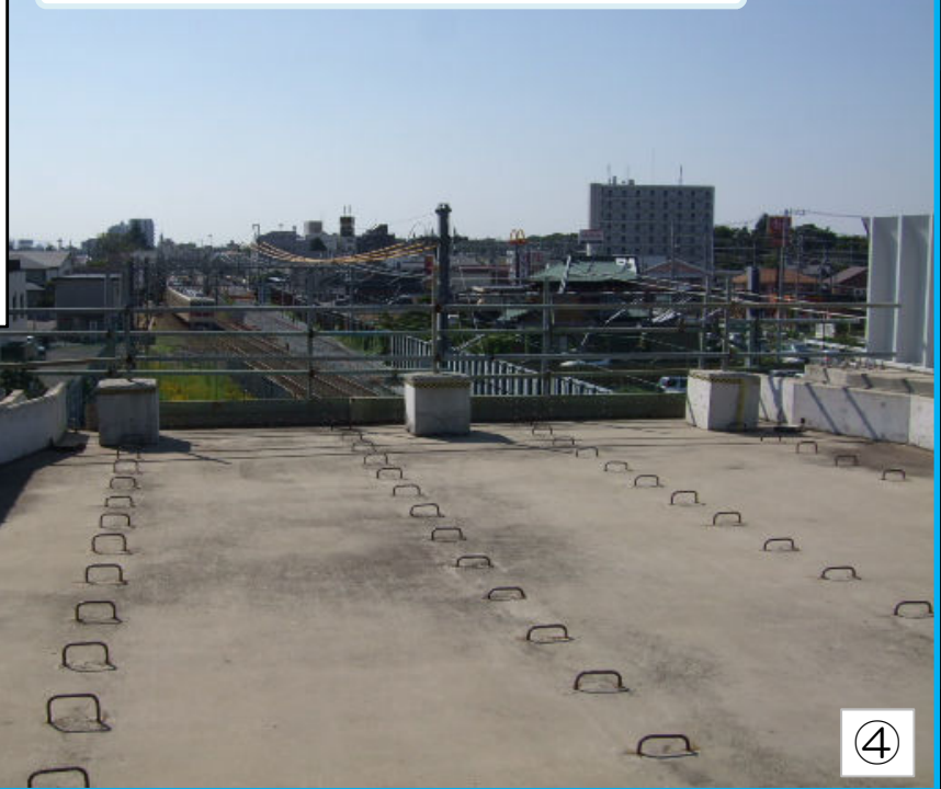
新鎌ヶ谷地区から初富駅方面へ(手前は完成した高架橋)