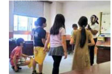
子ども英会話講座

子ども英会話講座: 3学年~6学年の学年ごと4クラスで開講 国の異なる4名の講師がシフト制で指導しています。 子ども達には英会話だけではなく、感染回避の教育も行っています。