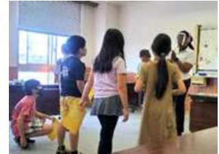
子ども英会話講座

子ども英会話講座: 3 学年~6 学年の学年ごと 4 クラスで開講 国の異なる 4 名の講師がシフト制で指導しています。 子ども達には英会話だけではなく、感染回避の教育も行っています。