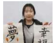
* コロナ前のお習字会で