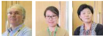
英語講座・中国語講座・韓国語講座の各講師