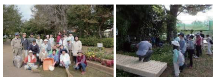
公園等サポーターによる市民参加の公園管理