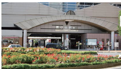
駅前の緑化による良好な都市景観の形成