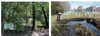
栗野地区公園の整備(第一期整備区域)