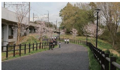
桜×鎌ヶ谷=魅力アップ事業による桜の植樹緑道(総合運動公園)の整備