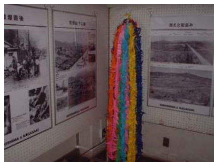
児童生徒が平和への願いを込めて折った折り鶴