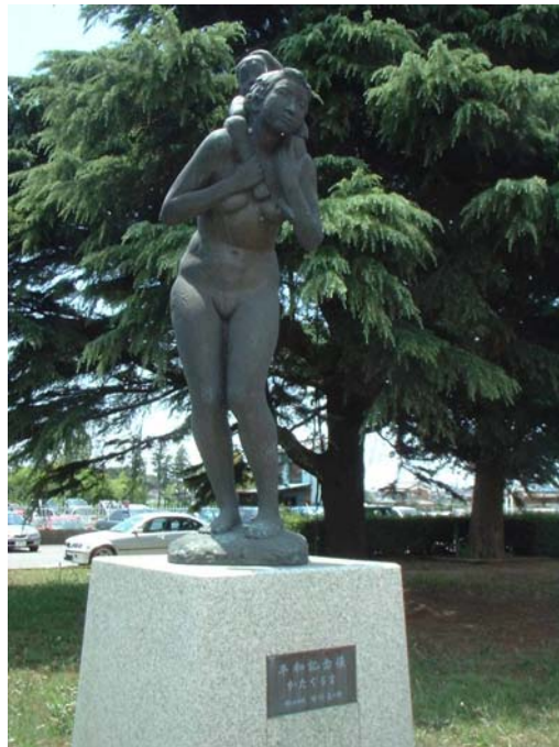
平和記念像 かたぐるま (設置場所 市庁舎前広場)