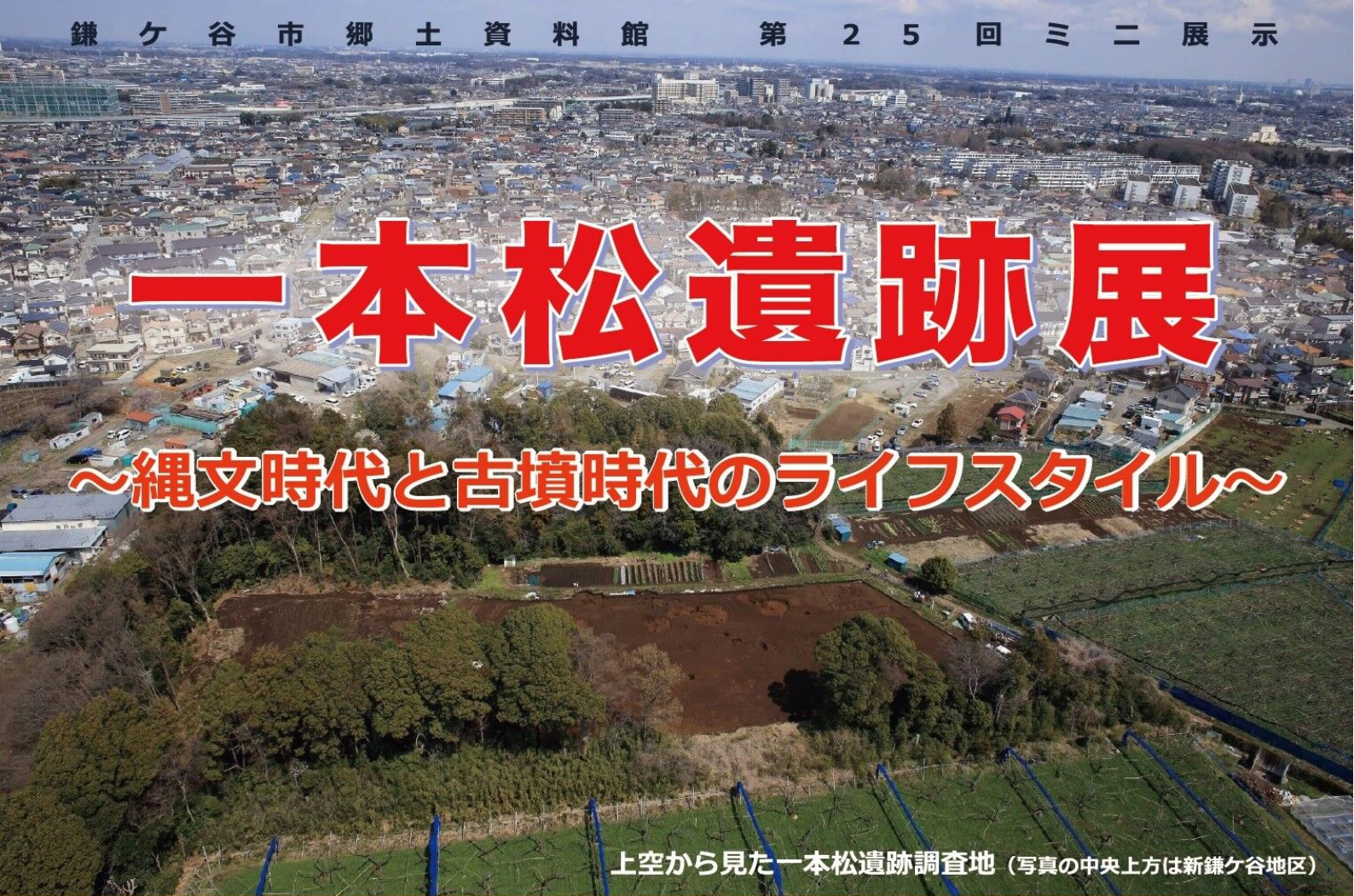
上空から見た一本松遺跡調査地（写真の中央上方は新鎌ヶ谷地区）