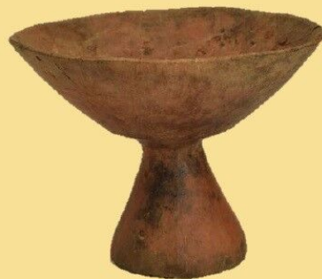
高坏（たかつき：古墳時代前期）