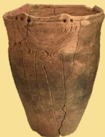
深鉢（ふかばち：縄文時代後期）