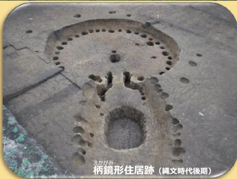
えかがみ 柄鏡形住居跡（縄文時代後期）