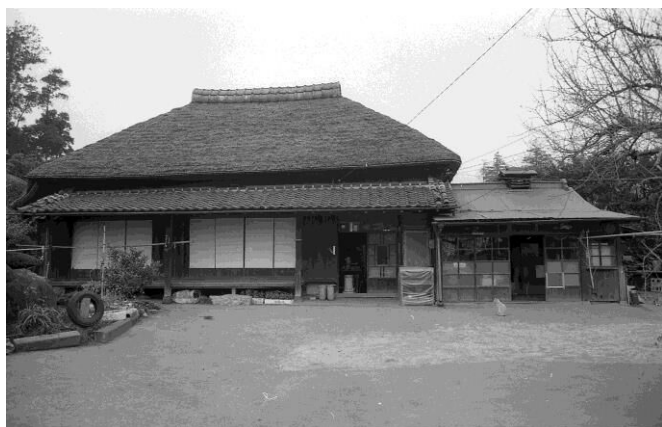
初富の民家（平成元年2月）