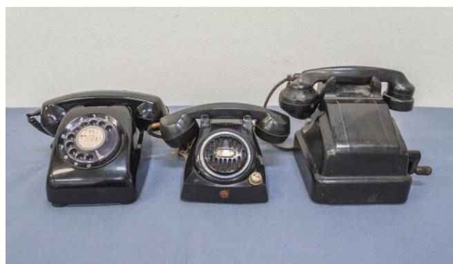
左から本文中の①・②・③の電話機

次に②(写真中)は「有線電話装置」といっ て、ダイヤルやボタンがなく、受話器を取る と交換手につながる仕組みです。機器の中央 部にはスピーカーが付いており、一定区域内