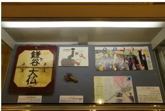
展示のようす(「新京成電鉄行先標」など)

令和6年10月で設立から78年を迎えた新京成電鉄は、昭和21年(1946)10月18日に旧日本陸軍鉄道第二連隊演習線跡地の払い下げを受けた京成電鉄が設立し、翌22年(1947)12月27日に戦後最初の新設鉄道として新津田沼ー薬園台間で開業しました。昭和30年(1955)4月21日には、京成津田沼ー松戸間が全線開通し現在に至っています。