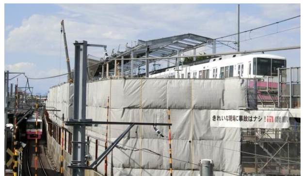
片側が高架運行を始めた「初富駅」

今回の展示では新京成電鉄78年のあゆみを、同社からお借りした年表や写真パネル、当館の収蔵資料などで振り返ります。