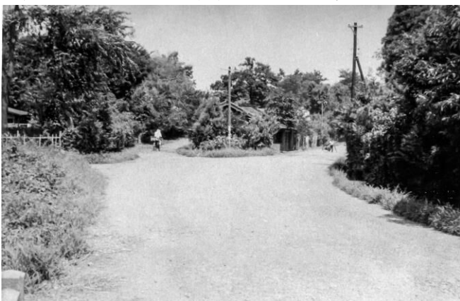
昭和30年頃の木下街道と井草三叉路

鎌ヶ谷市では、市史編さん事業や郷土資料館が調査した際の写真、個人の方が撮影した民俗