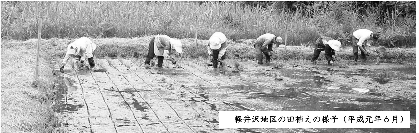
軽井沢地区の田植えの様子（平成元年6月）