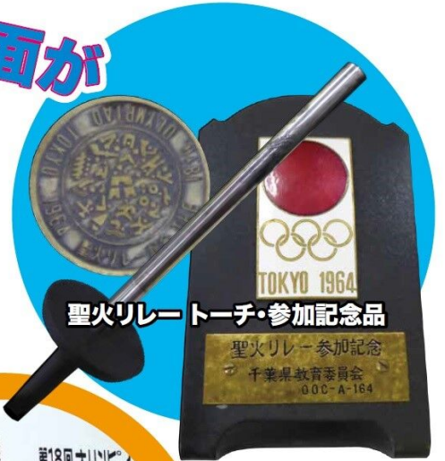
聖火リレートーチ・参加記念品