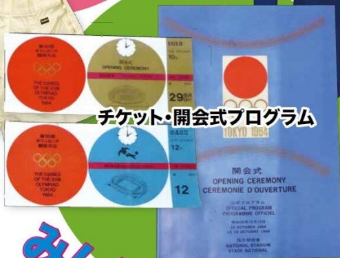
チケット・開会式プログラム