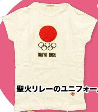
聖火リレーのユニフォーム