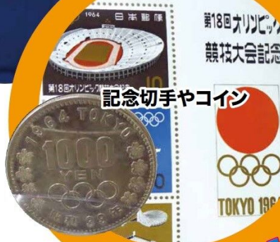
記念切手やコイン