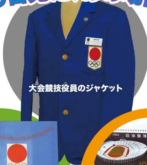
大会競技役員のジャケット